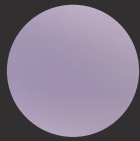
グロッシーパープル (光沢仕上げ)

新たなときめきを感じさせる、美しく気品のあるカラー。光沢仕上げのグロッシーパープルはなめらかな、OPPO Glow加工のシルバーグレーはマットでサラサラとした手ざわりを楽しめます。