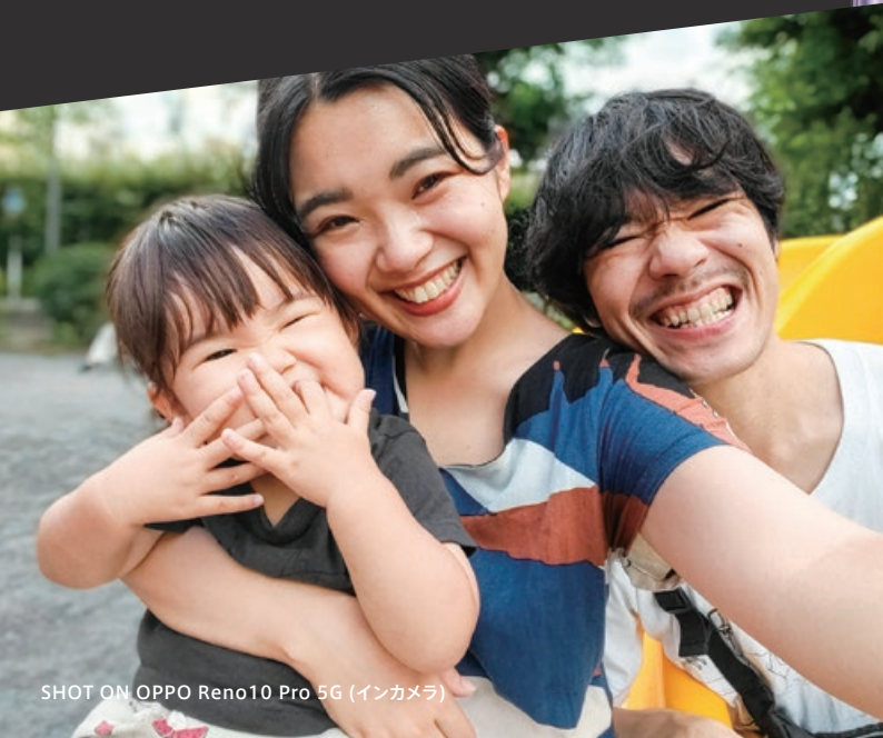
SHOT ON OPPO Reno10 Pro 5G (インカメラ)