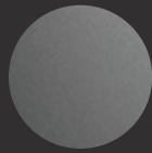
シルバーグレー (OPPO Glow仕上げ)