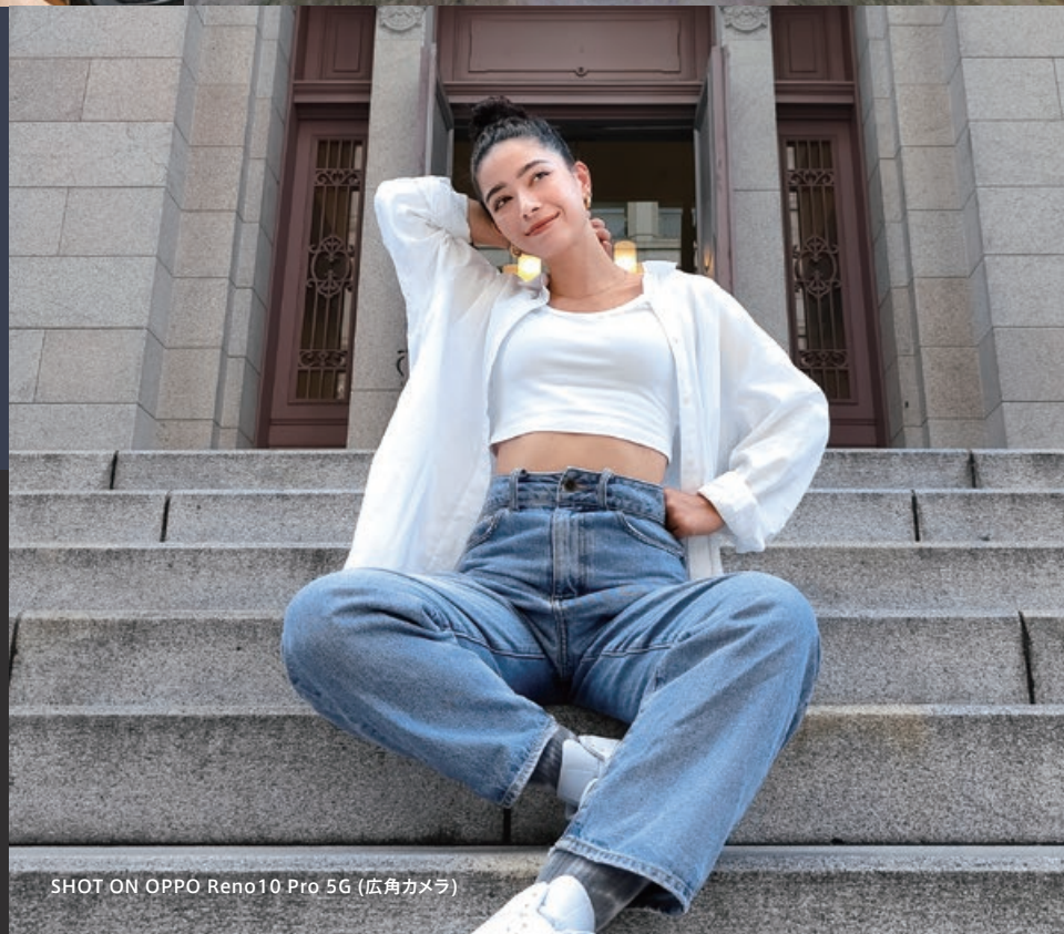
SHOT ON OPPO Reno10 Pro 5G (広角カメラ)

ソニーのIMX890フラッグシップセンサーを搭載。夜間や明暗差が強いシーンでも、鮮やかに撮影できます。