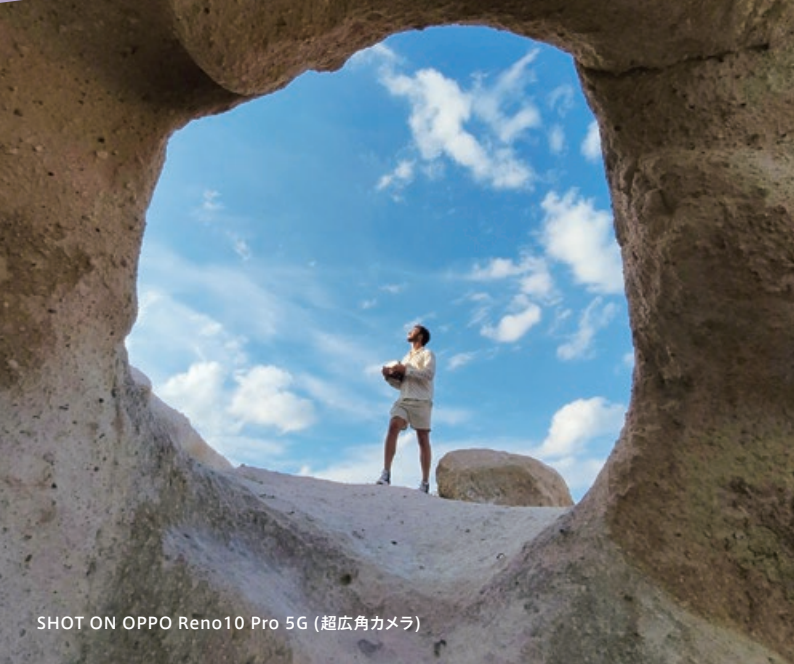
SHOT ON OPPO Reno10 Pro 5G (超広角カメラ)